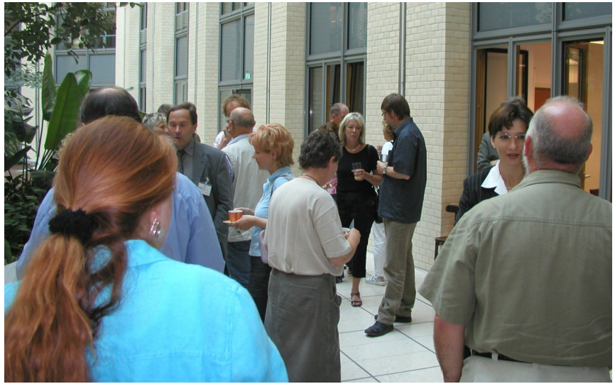
Aufnahme während der Pause eines früheren Treffens zum Erfahrungsaustausch